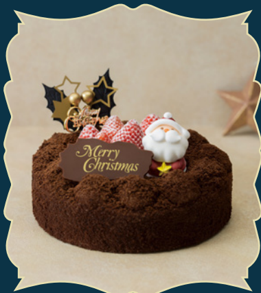
CHRISTMAS CHOCOLAT DOUBLE クリスマスショコラドゥブル