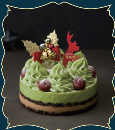
FORÊT PISTACHE NOËL フォレピスターシュノエル