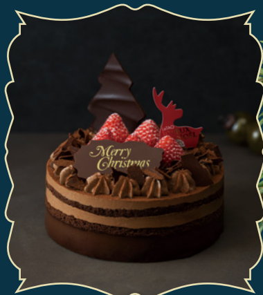
FORÊT CHOCOLAT NOËL フォレショコラノエル