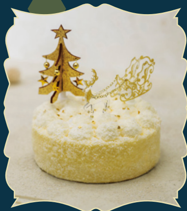
CHAMPAGNE DOUBLE シャンパンドゥブル