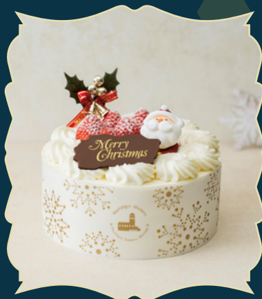
STRAWBERRY CHRISTMAS 苺のクリスマス