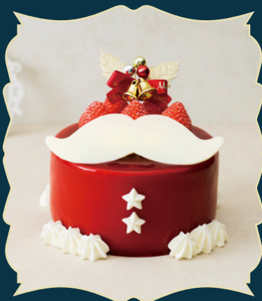
SANTA CLAUS サンタクロース