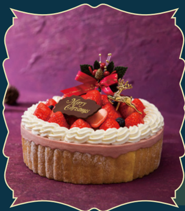
STRAWBERRY CHARLOTTE 贅沢いちごのシャルロット

Y ケーキ本体には1%未満、シャンパンソースには1%以上のアルコールが含まれています。