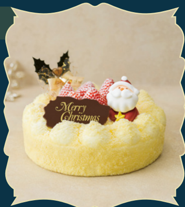
CHRISTMAS DOUBLE クリスマスドゥブル