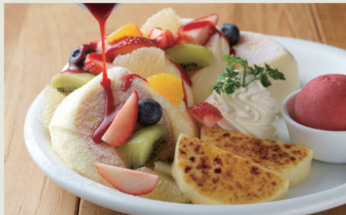
パンケーキ カタラーナフリユイ

オレンジ・苺・キウイ・ブルーベリー・グレープフルーツなど色とりどりの5種のフルーツにベリーソルベとベリーソースの爽やかな酸味を合わせました。香ばしくプリュレしたカタラーナのkok深さと酸味のマリアージュをお楽しみください。