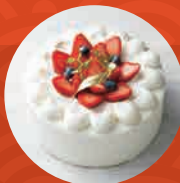
苺のデコレーション