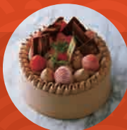
苺の生チョコ デコレーション