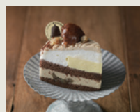
GRAND MARRON 〜グランマロン〜 税込(8%)¥486