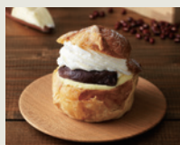
北海道あずき バターパイシュー 税込(8%)¥378

ドレモルタオ Doremo Nostalgic Modern LeTAO *Northern Sweets Manner*