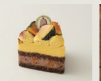
ポティロンショコラ 税込(8%)¥540