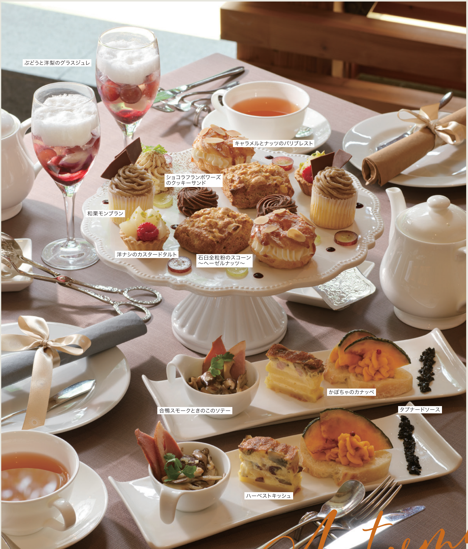
ぶどうと洋梨のグラスジュレ