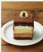
ショコラショコラ