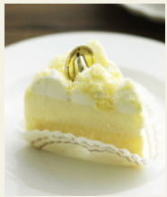
北海道限定 ドゥーブル フロマージュ