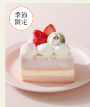
苺みるく ショートケーキ