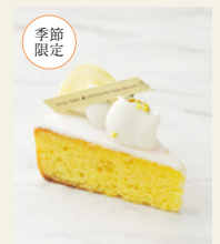
ウィークエンド シトロン

本製品には1%未満ですが アルコールが含まれています。 お子様やアルコールに弱い方は ご注意ください。