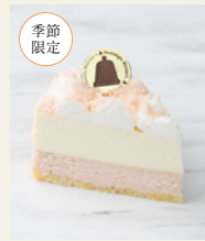
北海道限定 フレーズドゥーブル ～北海道苺～