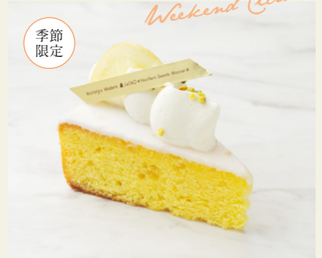
ウィークエンドシトロン

本製品には1%未満ですがアルコールが含まれています。 お子様やアルコールに弱い方はご注意ください。