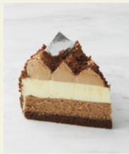
北海道限定 ショコラドゥーブル