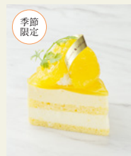
甘夏みかんの フロマージュショート