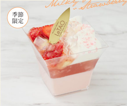
ミルキープディング〜ストロベリー〜