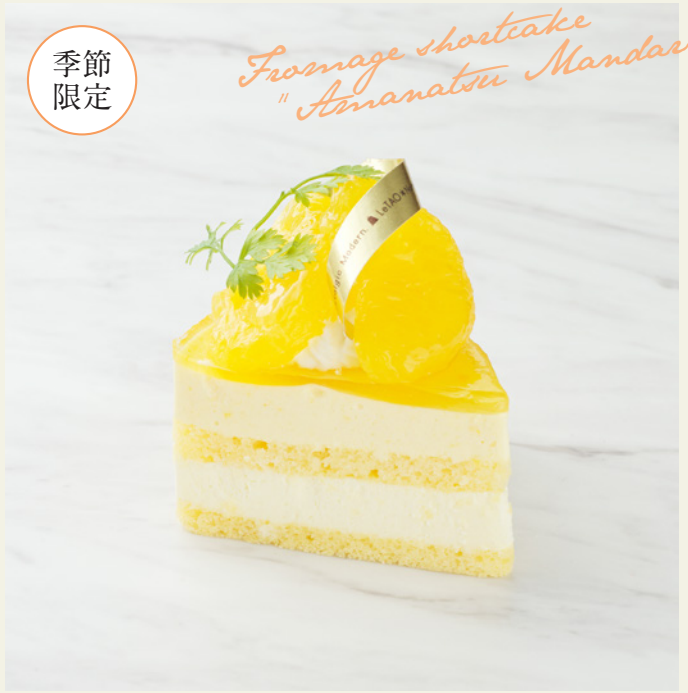
甘夏みかんのフロマージュショート