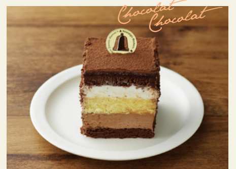
ショコラショコラ