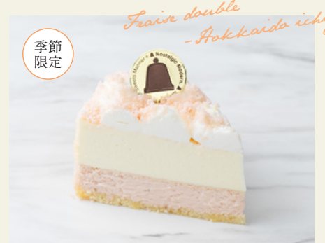
北海道限定 フレーズダブル～北海道苺～