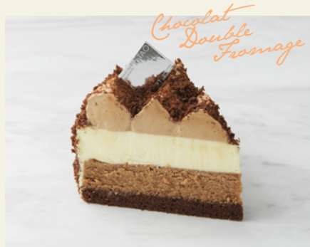
北海道限定 ショコラダブル