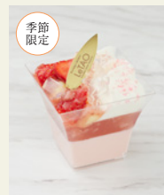
ミルキープディング ～ストロベリー～