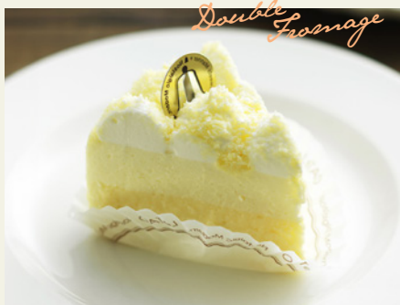
北海道限定 ダブルフロマージュ