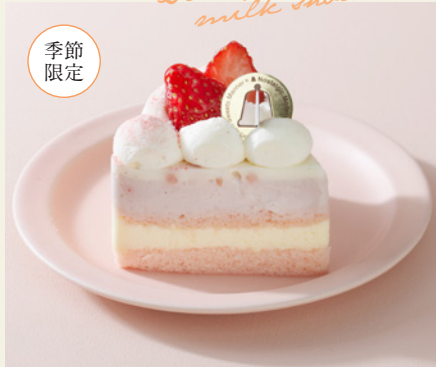
苺みるくショートケーキ