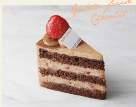
ガトーフレーズショコラ